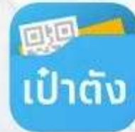
แอปพลิเคชัน เป๋าตัง