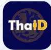
แอปพลิเคชัน ThaiID

โดยยืนยันตัวตนและเข้าใช้งานด้วย DIGITAL ID