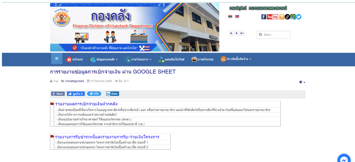
รูปภาพที่ 3

3. เมื่อคลิกแล้ว จะพบหน้าการรายงานข้อมูลการเบิกจ่ายเงินนอกงบประมาณ ผ่าน GOOGLE SHEET แสดงตามรูปภาพที่ 3