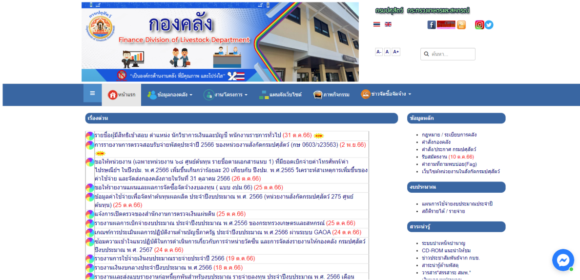
รูปภาพที่ 1

1. เปิดเว็บไซต์ กองคลัง กรมปศุสัตว์ https://finance.dld.go.th/th/index.php/th/ ตามรูปภาพที่ 1