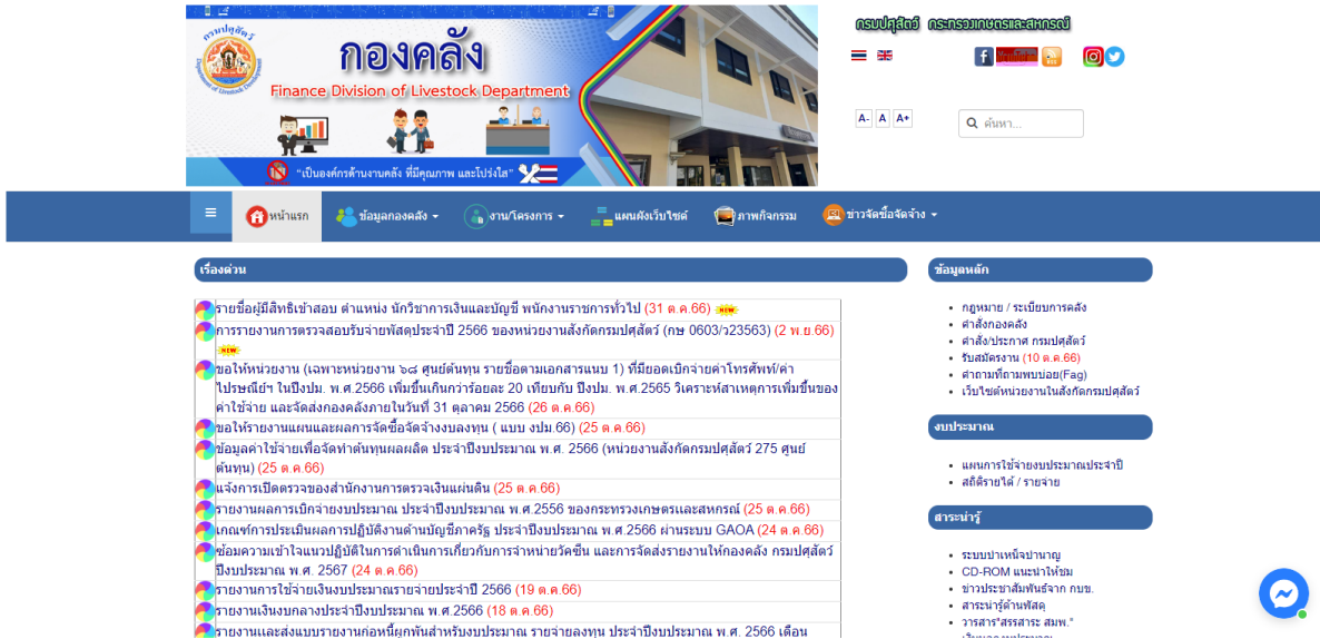
รูปภาพที่ 1

1. เปิดเว็บไซต์ กองคลัง กรมปศุสัตว์ https://finance.dld.go.th/th/index.php/th/ ตามรูปภาพที่ 1