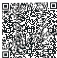
สิ่งที่ส่งมาด้วย ๑

กองระบบการคลังภาครัฐ กลุ่มงานบริการและประชาสัมพันธ์ โทรศัพท์ ๐ ๒๐๓๒ ๒๖๓๖ และ ๐ ๒๒๙๘ ๖๖๖๐ ไปรษณีย์อิเล็กทรอนิกส์ gfmis1@cgd.go.th