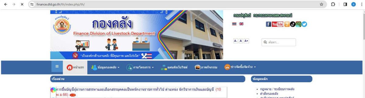
รูปภาพที่ 1

1. เปิดเว็บไซต์ กองคลัง กรมปศุสัตว์ https://finance.dld.go.th/th/index.php/th/ ตามรูปภาพที่ 1