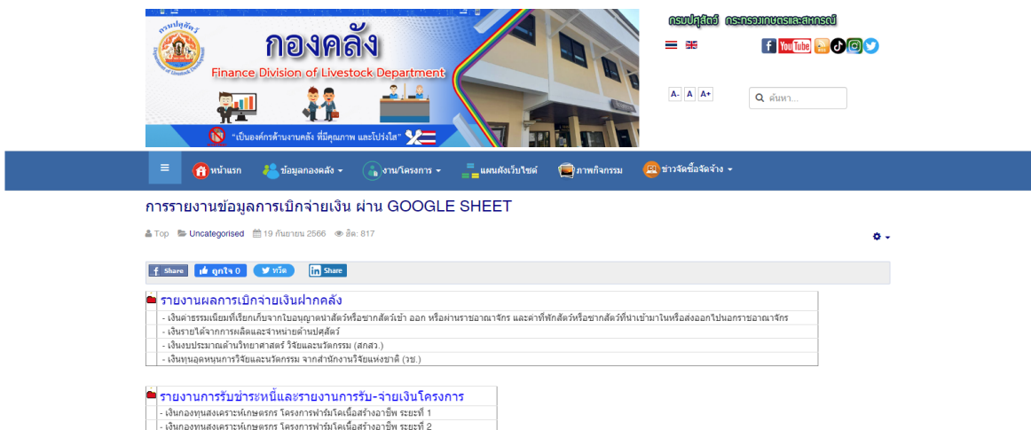
รูปภาพที่ 3

3. เมื่อคลิกแล้ว จะพบหน้าการรายงานข้อมูลการเบิกจ่ายเงินนอกงบประมาณ ผ่าน GOOGLE SHEET แสดงตามรูปภาพที่ 3